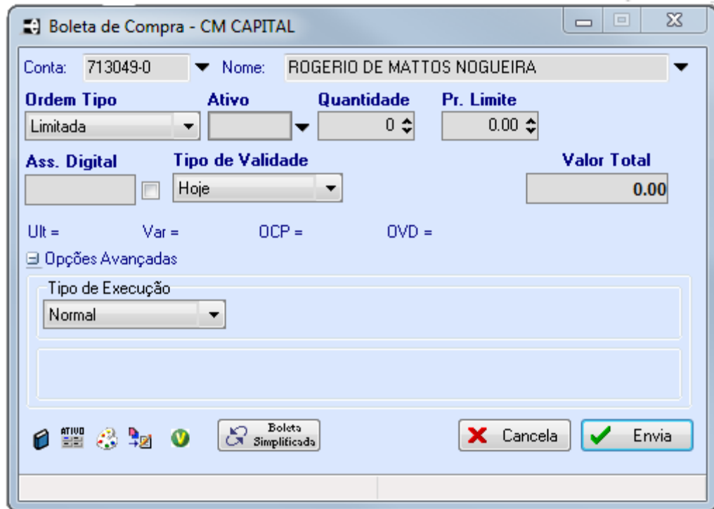
Boleta com Opções Avançadas

Selecionando a Ordem do Tipo "Stop Limitada" serão adicionados o Pr. Gatilho* e Data de Validade*: